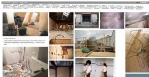
Figure 9. Site internet, mot-clef "charpente" sélectionné.