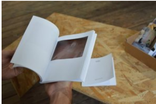
Figure 13. Vue de l'exposition Chantiers domestiques, « sculptures de chantier »