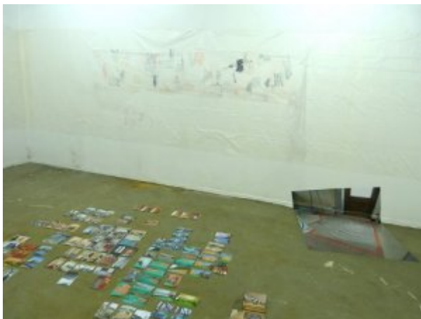
Figure 5. Labo 2016, regard sur quelques groupements d'images.