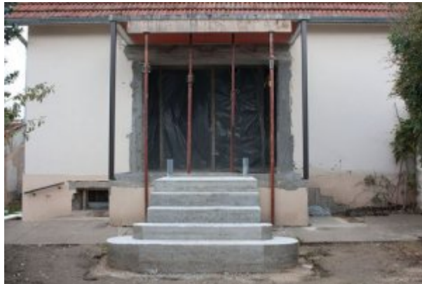
Figure 2. Perspective_Résidentielle © Jade Tang, 2013

Avec Perspective résidentielle , Jade Tang passait plus de temps sur les terrains, en les photographiant et en recueillant des témoignages de celles et ceux qui y œuvrent tout en y habitant. De cette première collecte d'images, de sons et de dialogues, elle a observé la relation interdépendante qui s'instaure entre l'habitant·e [4] qui façonne son espace de vie et cet environnement existant qui influence sa façon de vivre.