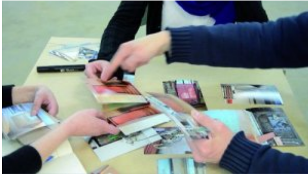
Figure 4. Labo 2016, deux œuvres et des dizaines d'images.