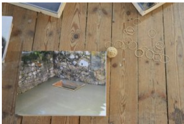
Figure 14. Vue de l'exposition Chantiers domestiques, « une pièce en plus »