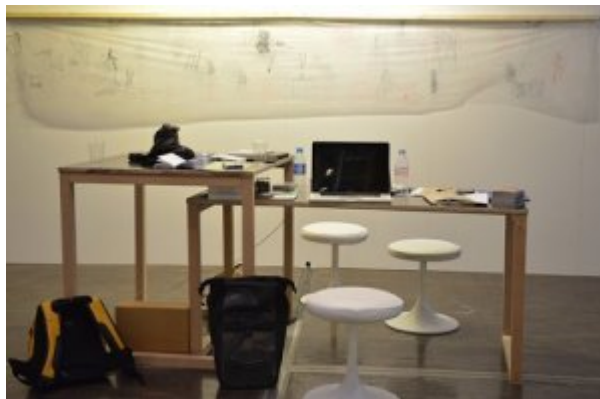
Figure 7. Espace de travail collectif dans l'exposition Perspective Résidentielle #4

À ce dispositif d'accueil et de présentation s'est ajouté un « atelier participatif », animé par l'équipe. Une vingtaine de personnes y ont participé, architectes, travailleuses sociales, ergothérapeutes, psychologues, chercheur·es, consultant·es... toutes concernées par des problématiques liées à l'habitat. Des images de chantier produites par des artistes (J. Tang, F. Schramm, E. Atget, R. Adams, G. Matta-Clark, M. Bonvicini, S. Couturier...), des architectes et des habitant·es ont été projetées sur écran. Un temps de travail en sous-groupes s'est alors engagé afin de faire émerger quelques réalités que ces participant·es trouvaient significatives lorsqu'on parle de chantier, qu'on en relate les expériences vécues ou subies. L'engouement suscité par la présentation des images, qui a apporté "une autre vision du chantier", et la qualité des échanges avec les participant·es, ont enjoint à formuler un projet d'étude pour LMS dont l'orientation a été élaborée en suivant les perspectives amorcées depuis le labo initial jusqu'à l'issue de ces Assises.