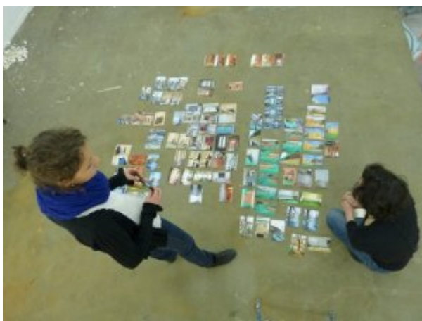
Figure 6. Labo 2016, annotations.